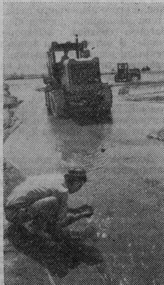
На поля целинного совхоза «Комсомол» Андижанской области пришла вода Большого Ферганского канала.

В кишлаках и районных центрах республики уже организовано более трехсот небольших предприятий и филиалов крупных заводов, фабрик. На них трудятся около сорока тысяч человек.