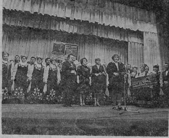
Эти снимки возвращают нас в Дни эстонской культуры в нашем городе. На левом снимке: выступает мужской хор «Кавур». На правом снимке: на торжественном закрытии Дней эстонской культуры в г. Сланцы.