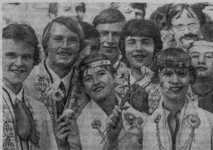
Участники самодеятельного танцевального ансамбля города Смилтене.

Чтобы наладить ритмичную доставку древесины с лесосек, проложили надежные подъездные пути. Все затраты с лихвой окупилась уже за первый год работы по новому методу. И теперь ежемесячно коллектив дает государству десятки тысяч рублей дополнительной прибыли.