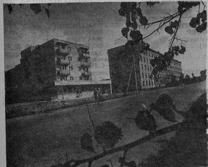
Последние дни осени.