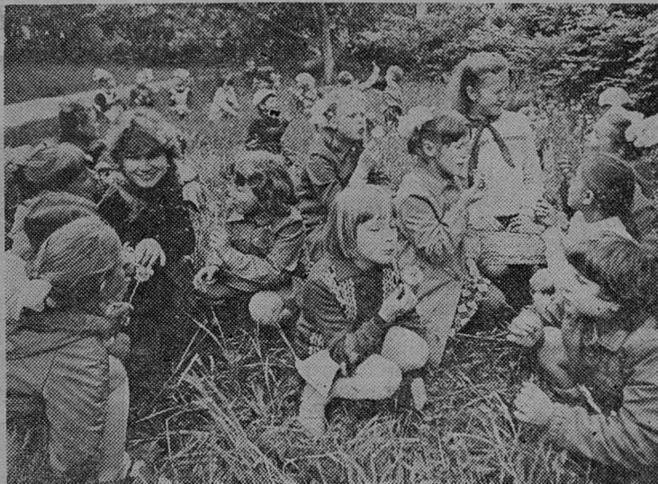
ИДЕТ ПИОНЕРСКОЕ ЛЕТО