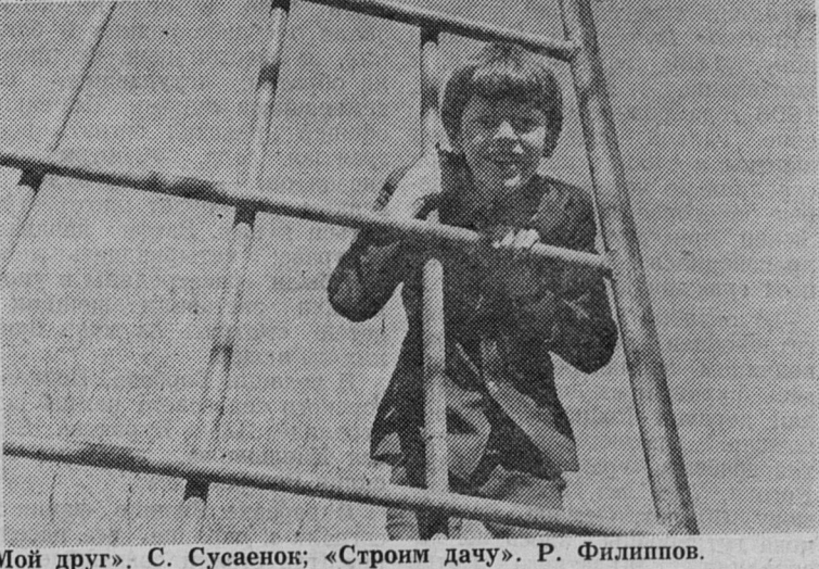
«Хозяюшка». А. Ершов; «Дядя Ваня спешит в баню», «Мой друг». С. Сусаенок; «Строим дачу». Р. Филиппов.