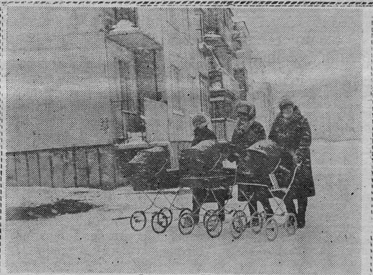
В любую погоду.

Внедрить данный вид лечения в большом объеме из-за недостатка специалистов в настоящее время не представляется возможным. Пригласить дополнительных специалистов не имеет возможности, потому что испытываем трудность с предоставлением им жилья.