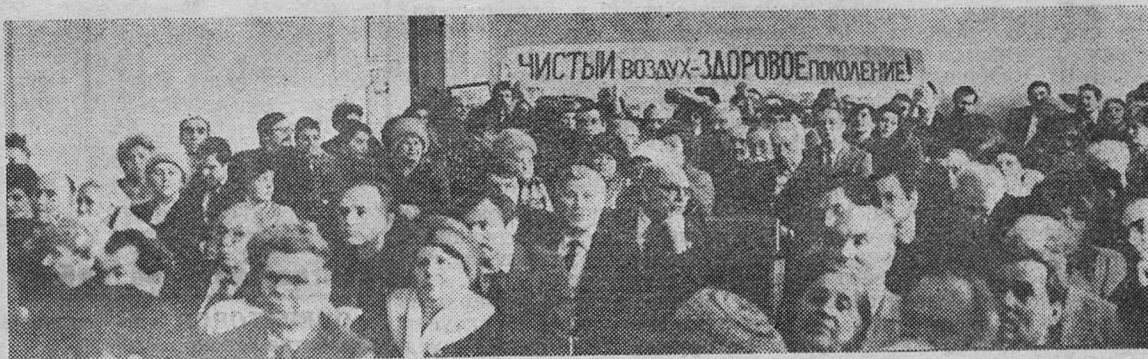
Встреча проходила при полном зале

тогда зародилась эта идея. И я считаю, что мы правильно следовали, что пошли на строительство электродного кокса. В противном случае, повторю, существующие вопросы нам бы не решить.