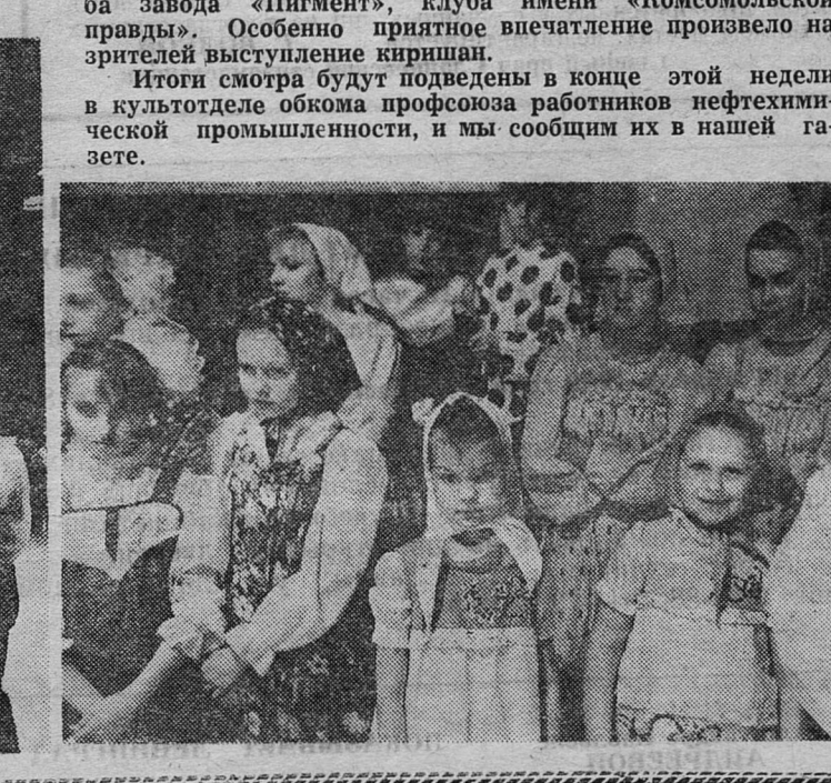
Смотр хореографического искусства «Танцевальный калейдоскоп» проходил в рамках III Всесоюзного фестиваля народного творчества.