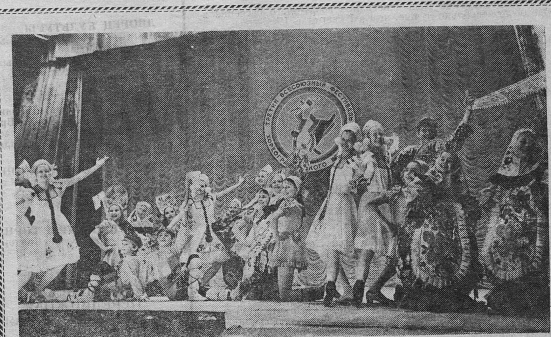
СМОТР ХОРЕОГРАФИЧЕСКОГО ИСКУССТВА