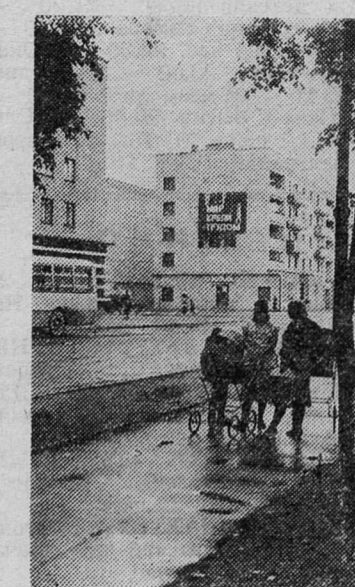
После дождя. Улица Кирова.

Из редакционной почты На днях в передаче «600 секунд» прозвучала информация, что под Ленинградом горят леса. А кто виновник пожаров в лесах? Конечно, мы сами. Стоит хорошая солнечная погода, пора походов по лесу, по берегам озер, рек. Ведь есть у нас места, где можно хорошо отдохнуть, подышать чистым воздухом. Но, отдыхая на берегу реки, давайте не будем забывать о других. Уходя с места отдыха, не забывайте потушить костер, убрать за собой мусор. Дайте возможность и другим полюбоваться непогубленной красотой. Еще обращаясь к любителям прекрасного, не рвите больше «веники», для букета пойдут три-пять ромашек. Радует глаз поле, усыпанное ромашками и колокольчиками, васильками. Л. СЕРГЕЕВА, д. Гостлицы.