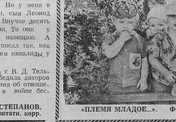
«ПЛЕМЯ МЛАДОЕ...»