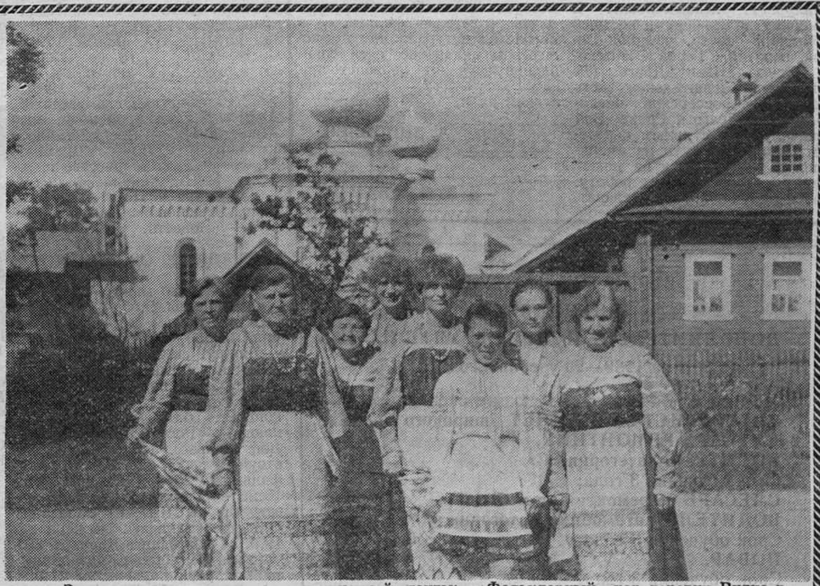
Этот снимок из конверта редакционной почты: «Фольклорный хор деревни Рудно в городе Тихвине».

— Не учитывается, так же, как у рабочих и служащих. Стаж, установленный по свидетельским показаниям, учитывается только для назначения основного размера пенсии без надбавок.