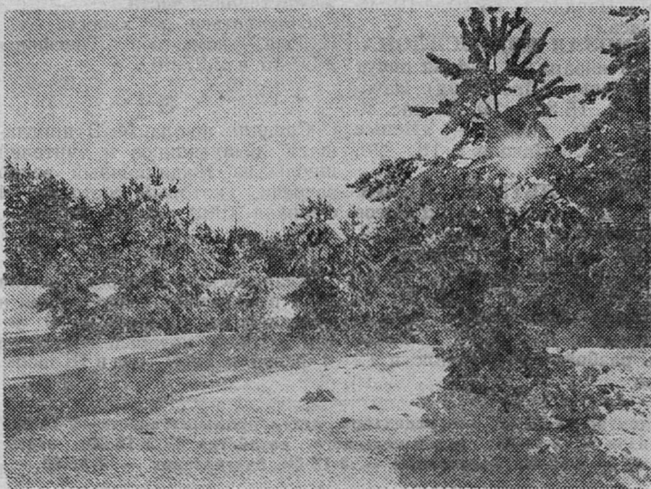
Чудесный уголок природы.