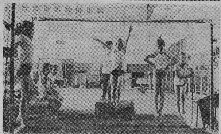
В спортивной школе идут тренировки.

Для жителей Лучек имеются промтоварные магазины, торгующие всеми необходимыми товарами, кроме сложнотехнических и мебели. В том числе на территории колхозного рынка расположен магазин уцененных товаров, принадлежащий райпо.