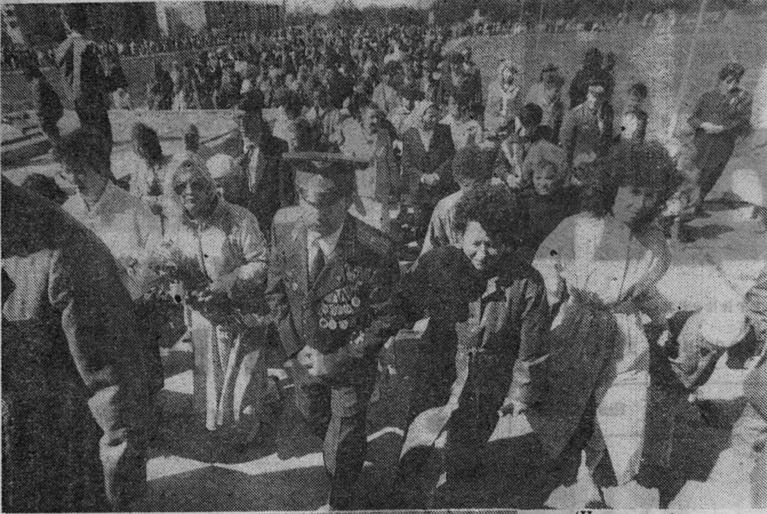
(Начало на 1-й стр.)