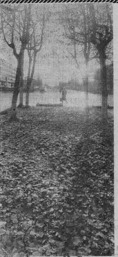
Фотоотряд Ю. Терентьева.