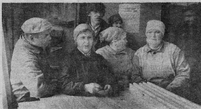
Коллектив бывшего подразделения государственного предприятия решил попробовать свои силы в новой для него организации Труда