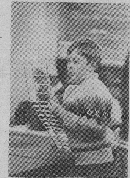
Фото и текст Ю. Голубева.

И пусть не все добьются больших успехов или свяжут свою будущую профессию с небом — любой постигнет в кружке старательную работу и обращение с различным инструментом, так необходимым будущему мужчине. А еще Павел Владимирович обязательно научит доброте.