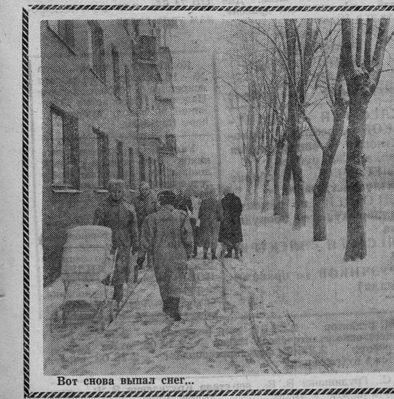
Вот снова выпал снег...

бурчание обремененной заботами мамы или недовольного папы. А, может, услышит и похлебку? — Заткнись, скотина! Ребенок лет 3—4 плакал, никак не мог успокоиться, в ответ на его плач мама так его «угуваривала». — Шевели ногами, я уже опаздываю! Замолчи наконец! Замолчи, не то убью!!! Приходилось тебе, читатель, слышать такое? Наверное... А потом дитя пойдет в школу, и у многих радость первого сентября скоро пропадет. А отучившись 10 лет (теперь 11), некий выпускник на стене своей родной школы напишет: «Прощай, каторга!». Видели такую надпись, читатель?