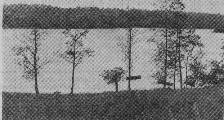
Наш край.