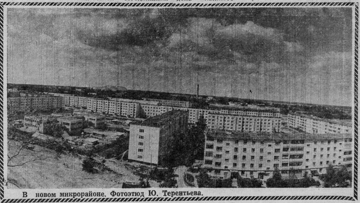
В новом микрорайоне.

Работа коллектива детского сада признана хорошей. Г. ИВАНОВА, рабкор.