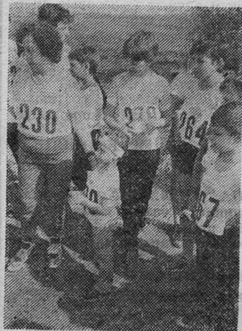
Организация городских соревнований показывает равнодушие к детям со стороны взрослых

Безотходной технологии вообще не существует у нас, об этом знает и школьник, но в то же время я понимаю, что надо как-то помогать людям.