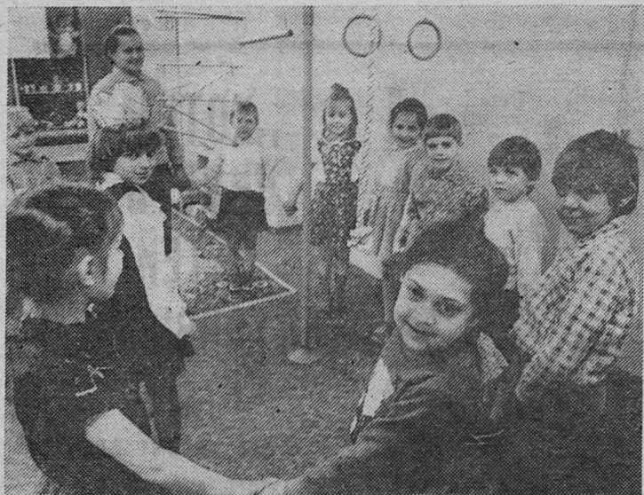
(Начало на 3-й стр.).

— Говорят и все делают для этого работники логопедического детского сада