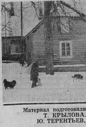
Материал подготовили Т. КРЫЛОВА, Ю. ТЕРЕНТЬЕВ.

Хозяйственная, работающая деревня, привыкшая заботиться сама о себе, кормить себя и горожан. Улягутся политические страсти, отзвучат словесные поединки, и люди поймут, что давно известно истинному хозяину, крестьянину — только труд всему голова, только он вселяет уверенность в завтрашнем дне.