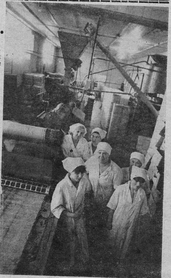
Производство организовано в две смены. В одну трудится бригада из Добруч, в другую — из Любимца. Ежедневно они производят 6 тонн печенья.

Два года назад при районном объединении «Агропромсервис» открылся кондитерский цех по производству печенья. Тогда многие с недоумением смотрели на такое решение руководства предприятия. Теперь же усматривают в нем большую пользу. Печенье этого цеха не залеживается на прилавках гдовских магазинов. Быстро раскупается не только из-за существующего дефицита кондитерских изделий, но и благодаря его хорошим вкусовым качествам. Цех расположен возле деревни Любимец.