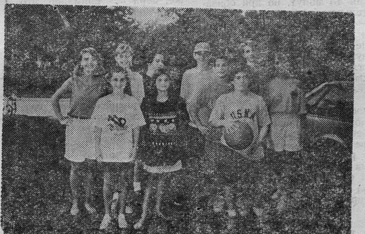
Вечером полдесятого, как правило, ложатся спать. Отдых — в субботу и воскресенье. Кроме занятий физкультурой непосредственно на уроках, довольно часто проводятся соревнования между школами.

Учебные дни были построены примерно в одном ключе. Занятия начинались в 7 часов 30 минут, заканчивались в 14 часов. После занятий тренировка, правда, не обязательная, но любимая большинством учащихся.