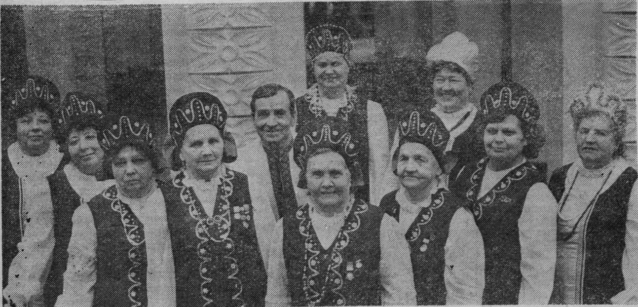
Фольклорный хор горняков отметил 30-летие. Запевалы его — ветераны. Этот снимок сделан в юбилейный вечер.