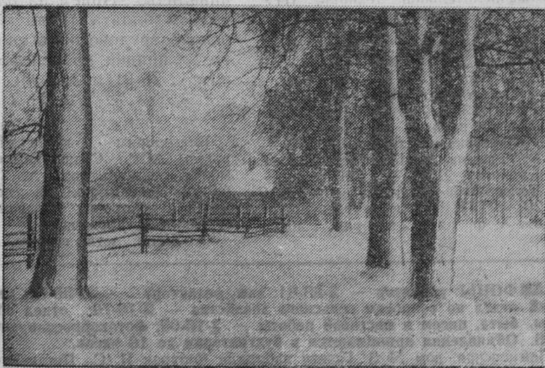
Последний снег.