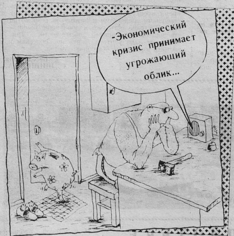
Рис. В. Шиловой.