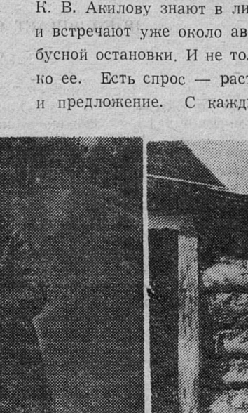
Из редакционной почты