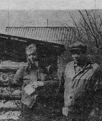
Из редакционной почты

Обратите внимание, с каким аппетитом дикторы радио и телевидения произносят слова: «нетрадиционные виды энергии». Мне всегда смешно слышать, а тем более читать эти слова. Даже ребенок, едва начав изучать историю, знает: человек первым делом освоил для своих нужд воду и ветер.