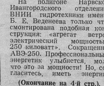
Из редакционной почты

Обратите внимание, с каким аппетитом дикторы радио и телевидения произносят слова: «нетрадиционные виды энергии». Мне всегда смешно слышать, а тем более читать эти слова. Даже ребенок, едва начав изучать историю, знает: человек первым делом освоил для своих нужд воду и ветер.