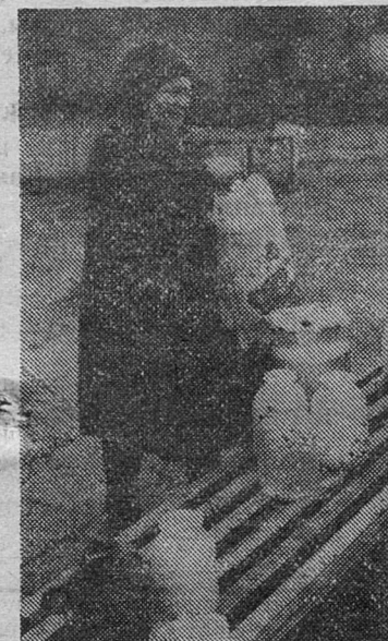
Из редакционной почты

Сегодня можно сказать, что знаменитое сближение села с городом «успешно» завершилось. Трех-, пятиэтажные коробки в деревнях будут грустным напоминанием