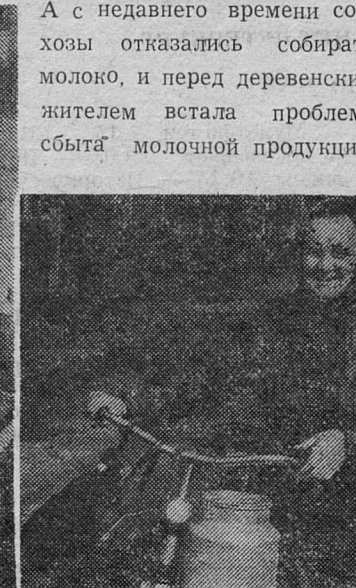
Из редакционной почты

с провалившейся кампании. За последние полгода-год изменился уклад жизни сельчан. По данным Загрявского сельского Совета в деревне на личных подворьях 73 коровы, у многих уже по две. А с недавнего времени совхозы отказались собирать молоко, и перед деревенским жителем встала проблема сбыта молочной продукции.