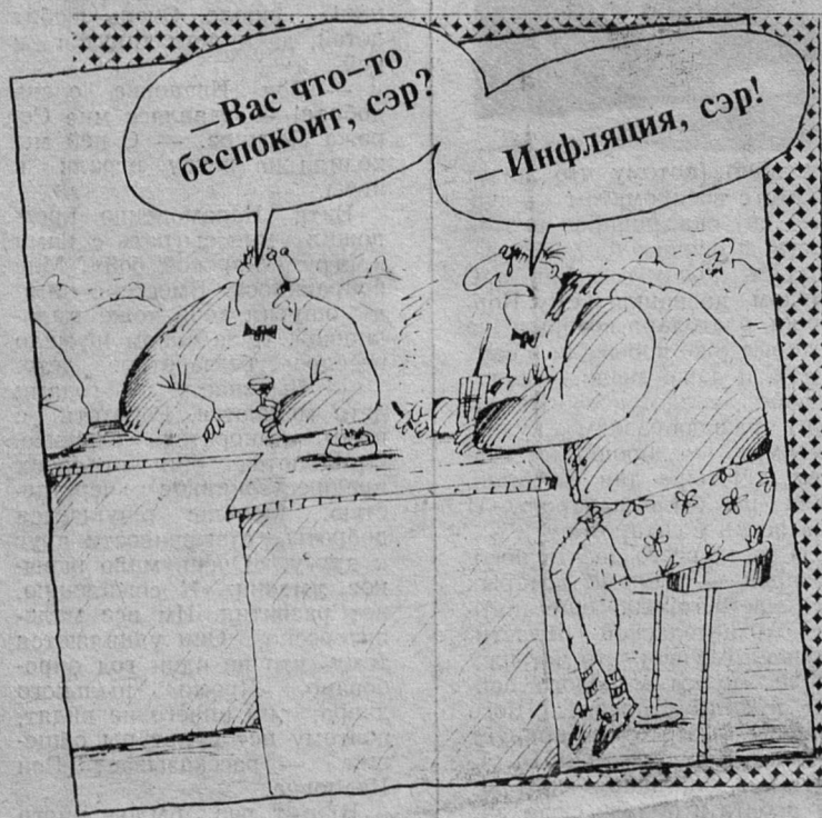
Рис. В. ШИЛОВА.