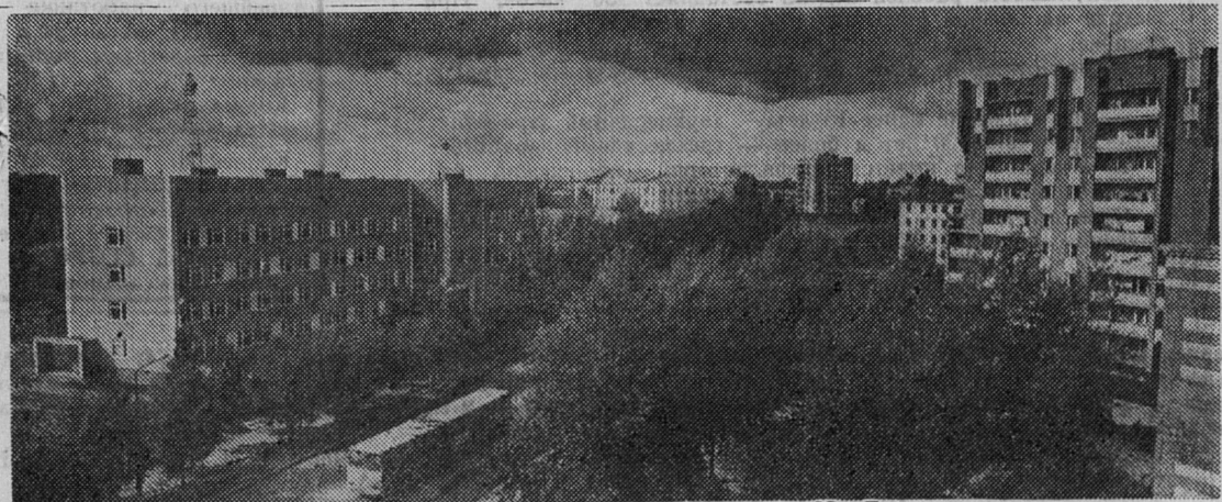
Последние дни сентября.