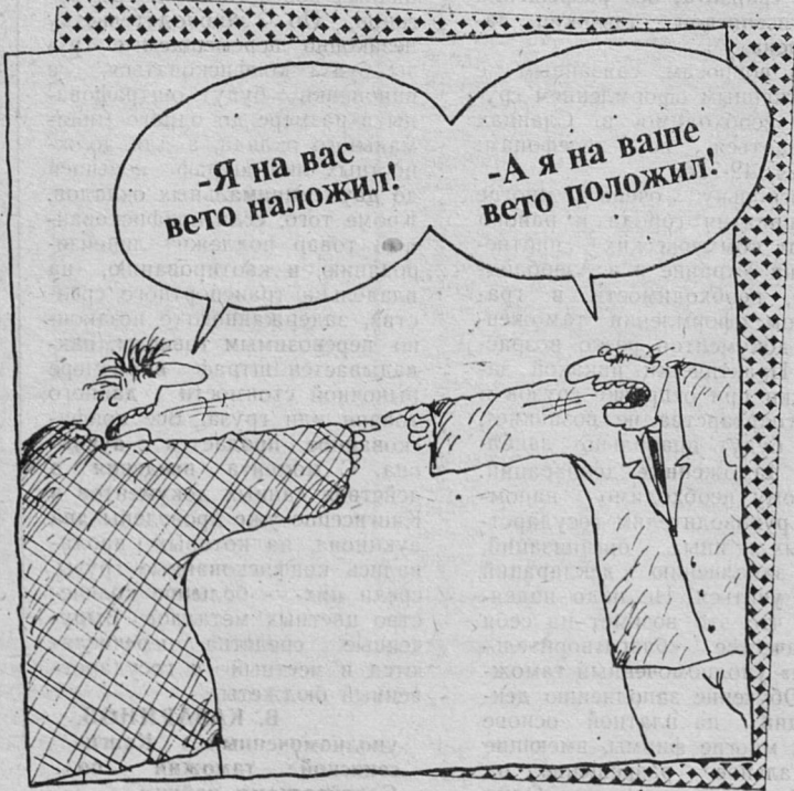
Рис. В. Шилова.

Выход пока возможен один: тресту придется, по-видимому, покупать баллонный газ по коммерческой цене. Но продавать населению этот газ трест будет только по фиксированным ценам, себе в убыток. На складе давно нет какого-то запаса баллонов, все, что поступает, немедленно развозится потребителям. В числе тех населенных пунктов, куда в ближайшие дни будут направлены машины с баллонами — Овсище, Старополье, Загрьеве. Давно не поступал газ и в Черновское, туда надо направлять сразу три машины. Работники газовой службы стараются делать все от них зависящее, чтобы снять напряженность сложившейся ситуации.