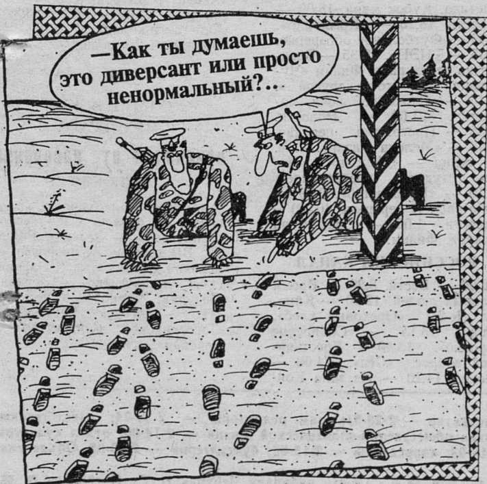
Рис. В. Шилова.