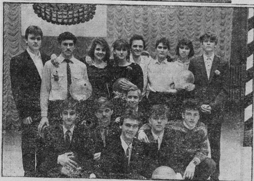
НА СНИМКАХ: команда школы № 6, победителя поздравляют спонсоры, очередное решение жюри.

Предстоящую пятницу, похоже, с нетерпением ждут многие сланцевчане. Послезавтра на сцене ДК СПЗ встретятся уже опытные команды, которые, кстати, не раз встречались друг с другом в конкурсах КВН — команды ЛПО «Ленинградсланец» и сланцеперерабатывающего завода «Сланцы». Кто окажется сильнее на сей раз? Думаю, что такой прогноз не возьмется делать никто. Узнаем в пятницу. А. ПАВЛОВ.