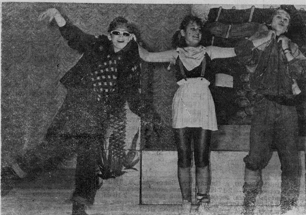
НА СНИМКАХ: сцены из спектакля «Пеппи, Длинный Чулок».