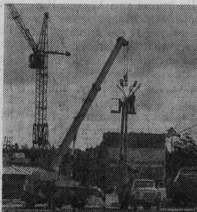
Наш город строится.