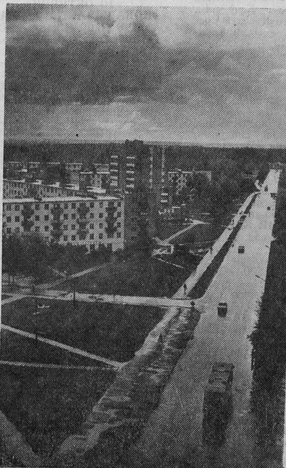
Г. Сланцы. Осень пришла.