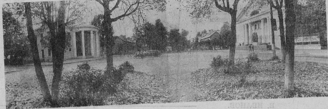
Г. Сланцы.

В среду, 13 октября, состоится очередное занятие литературного объединения Дворца культуры завода «Сланцы». Начало в 18 часов. Приглашаем всех желающих.