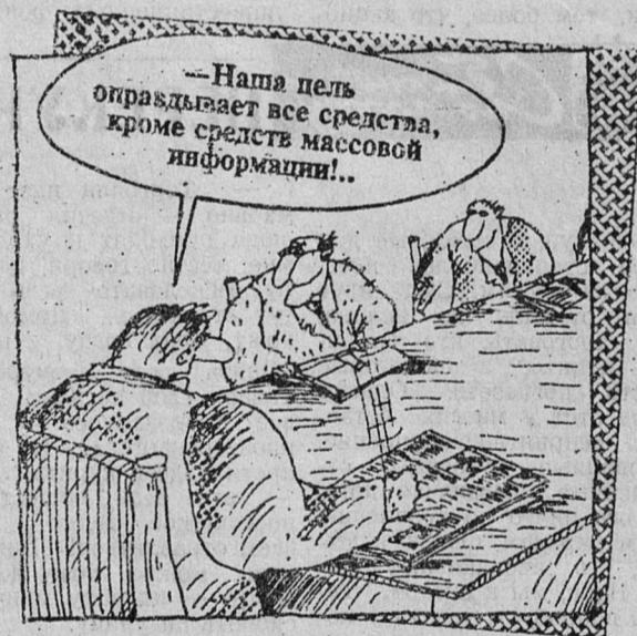
Рисует В. Шилов