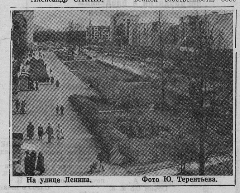
На улице Ленина.

Честно говоря, мы хотели бы стать единственной для вас турфирмой. Впрочем, какая фирма этого не хочет?.. Приходите, пишите нам по адресу: 190000, Санкт-Петербург, ул. В. Морская (Герцена), 35. Телефон 314-72-94, факс (812) 319-97-09. Александр САНИН.