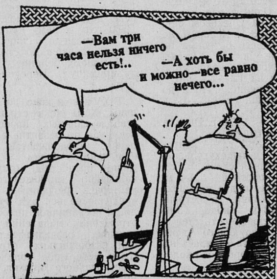
Улыбка художника... Рис. В. Шилова