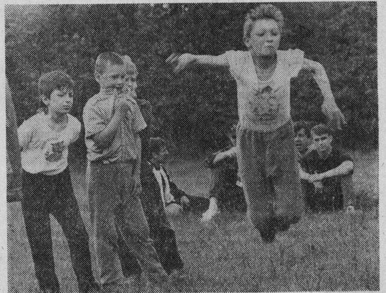
«Иду на рекорд!». Фотоэтиюд Ю. Терентьева.