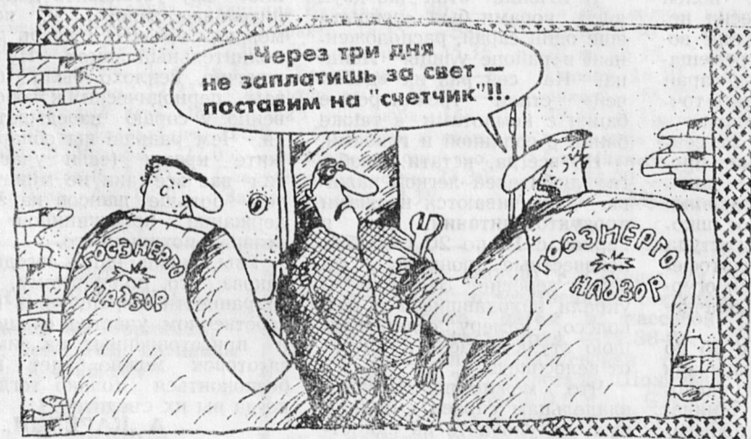
Рисует В. ШИЛОВ

Пресс-служба КУГИ Ленинградской области.