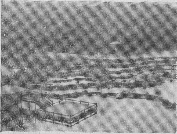
(Начало в №№ 219, 220.)

Праздничный день 7 ноября для нас был вновь деловым: мы посетили научный городок Кансай, расположенный в полутора часах езды от Киото. Этот городок называют городом XXI века, он еще строится, но там уже функционирует большой научный комплекс. Это детище трех префектур — Киото, Осака и Нара, центры их находятся на примерно равном удалении от комплекса. Около 44 процентов затрат покрывают бюджеты названных префектур, сколько-то доплачивает государство — так сказал нам переводчик. И более половины инвестируют около 170 частных компаний. Там идут исследования в области генной инженерии, производства композиционных материалов, а также по проблеме утилизации углекислого газа, так как рост его содержания в атмосфере угрожает глобальными потеплениями. Здания оригинальны по архитектуре — часть их видна на снимке. В фойе лабораторного комплекса находится некое блестящее ажурное вращающееся сооружение — индикатор углекислого газа. И достаточно дохнуть в воздухозаборное отверстие в стене здания, чтобы устройство начало вращаться быстрее — так высока чувствительность прибора.