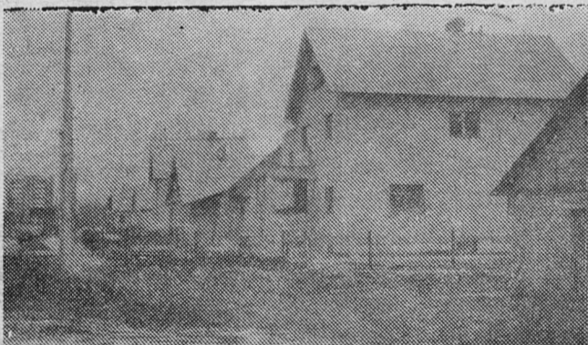
Окраина города: ул. Гавриловская застраивается.