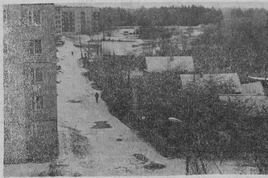
Город и деревня.