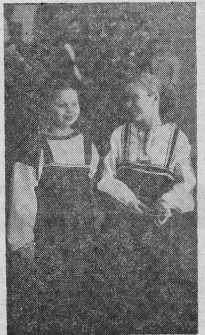
рых и творческих людей. Они нашли здесь понимание и единомышленников.