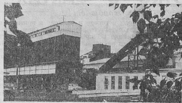
Промышленный пейзаж. Фотоэтиюд Ю. Терентьева.

Министерству энергетики, промышленности и торговли области предложено с администрациями городов и районов области определить места размещения будущих мини-пекарен с учетом их наиболее эффективного использования. На них, кстати, будет распространяться и действие недавно принятого закона о льготном налогообложении.