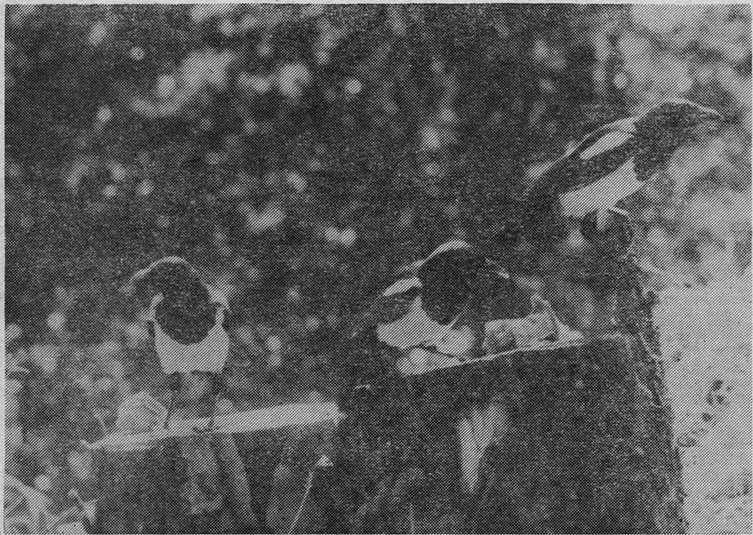
СОРОЧЬЕ СЕМЕЙСТВО.