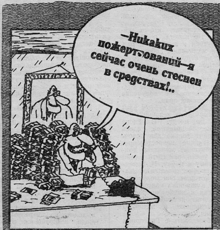
Рис. В. ШИЛОВА.