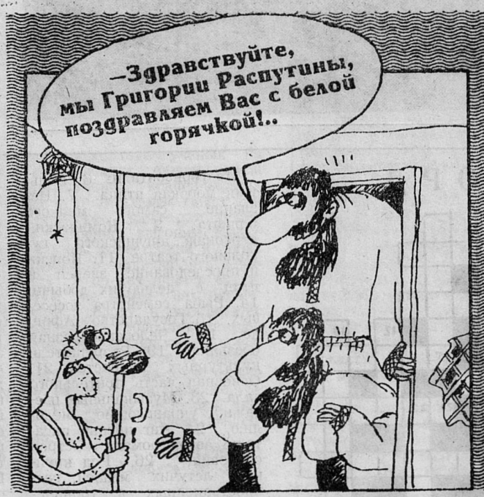
Рисунок Вячеслава ШИЛОВА