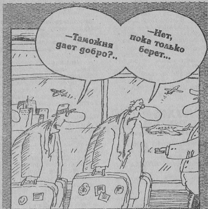
Рисует В. Шилов